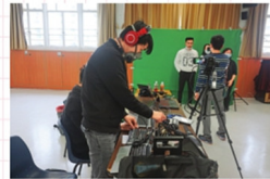
▲每次的網絡課堂，也需要各位教職通力合作，在電腦技術支援、拍攝等方面各司其職