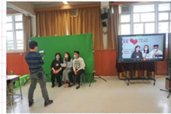
▲老師們在綠幕前拍攝，再配上不同的「特別效果」，十分專業