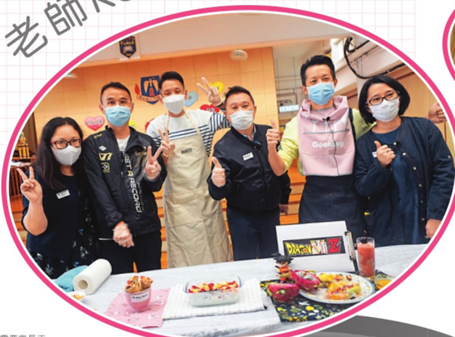
▲老師們展示自己的新煮意食品，然後由學生投票選出他們最喜愛的菜式