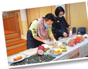
▲老師們分成三組比試廚藝，同學仔一邊觀賽，一邊吸收各學科的小知識