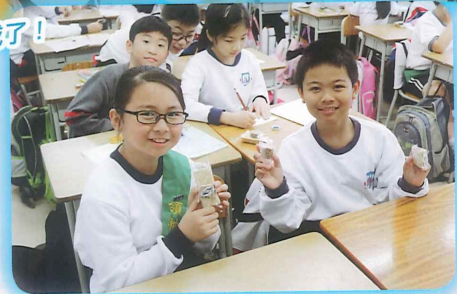
我們的下午茶完成了！