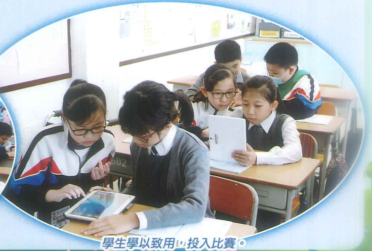
學生學以致用，投入比賽。