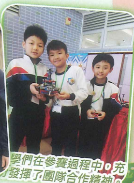
同學們在參賽過程中，充分發揮了團隊合作精神。