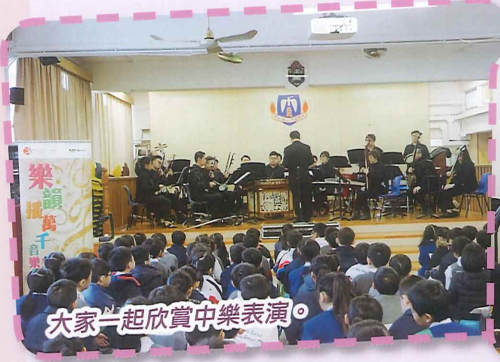
大家一起欣賞中樂表演。

本年度音樂科舉辦了多個音樂活動，一月初邀請音樂事務處中樂小組到校舉行「樂韻播萬千音樂會」。當日同學有機會欣賞由經驗豐富的中樂導師演奏的多首名曲，大家都投入在美妙的旋律中。