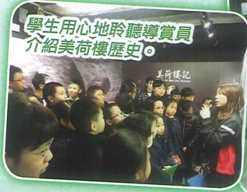
學生用心地聆聽導賞員介紹美荷樓歷史。

學生於本年度曾參加香港賽馬會社區資助計劃之「美荷樓」香港精神學習計劃，活動讓學生透過參觀美荷樓和參與互動工作坊，提升觀察事物的能力和寫作的興趣，亦讓學生通過細聽石硤尾邨舊居民的故事，從而認識更多香港昔日的社會和生活狀況，以及當中所承傳的香港精神。