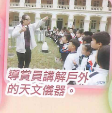
導賞員講解戶外的天文儀器。