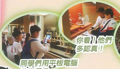
同學們用平板電腦欣賞展品。

五年級的學生參觀了香港歷史博物館的綿互萬里(世界遺產絲綢之路)。從中認識更多有關絲綢之路的歷史和當時文化，令同學們大開眼界。