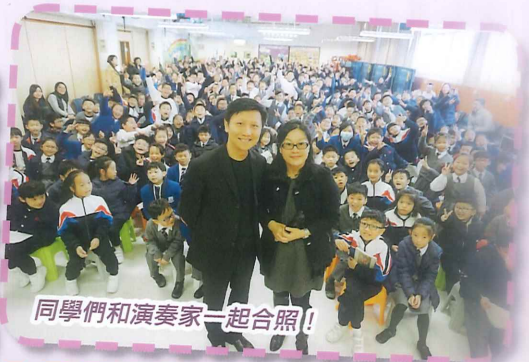
同學們和演奏家一起合照！