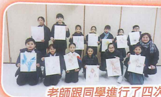
老師跟同學進行了四次「創意繪畫工作坊」，鍛煉繪花的技巧。