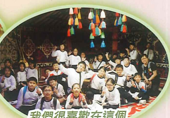
我們很喜歡在這個蒙古包來個大合照!