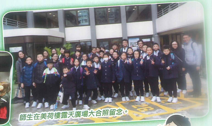
師生在美荷樓露天廣場大合照留念。