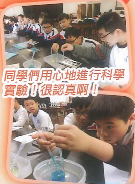
同學們用心地進行科學實驗!!很認真啊!!

本學期參加了兩次與聖公會曾肇添中學合作的「小小科學家」的活動。透過哥哥姐姐的帶領，嘗試了很多科學實驗和科學遊戲，真是獲益良多!