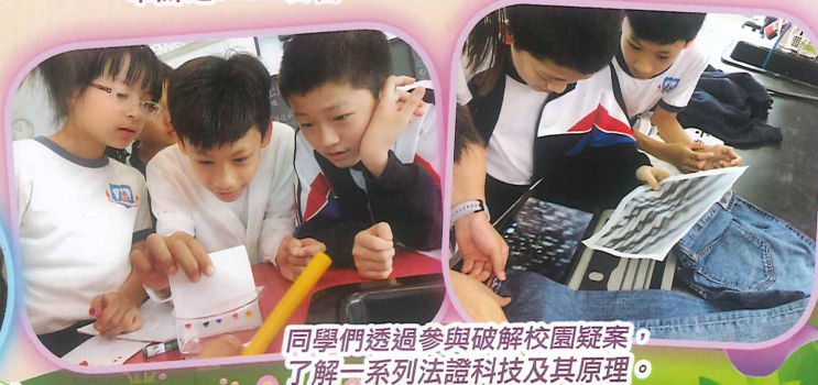
同學們透過參與破解校園疑案，了解一系列法證科技及其原理。