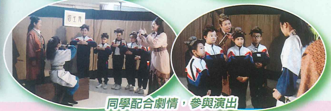
同學配合劇情，參與演出