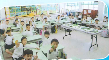
同學帶他們搜集的葉子，進行選美大會！