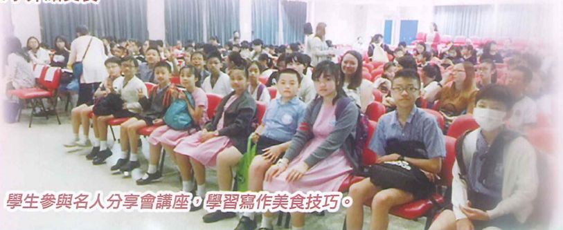
學生參與名人分享會講座，學習寫作美食技巧。