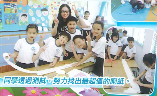
同學透過測試，努力找出最超值的廁紙。