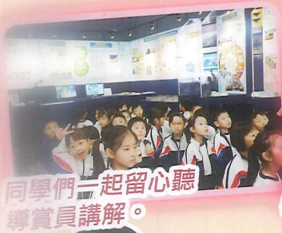
同學們一起留心聽導賞員講解。