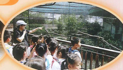
大家一起觀看雀鳥!