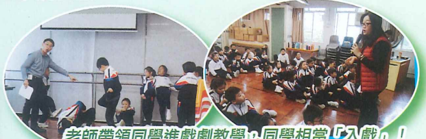
老師帶領同學進戲劇教學，同學相當「入戲」！