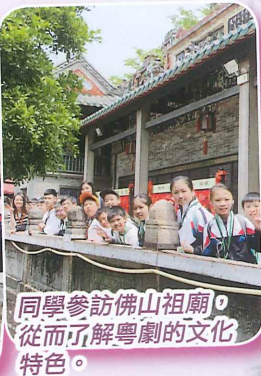
同學參訪佛山祖廟，從而了解粵劇的文化特色。