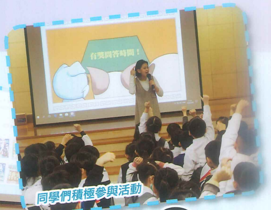
同學們積極參與活動