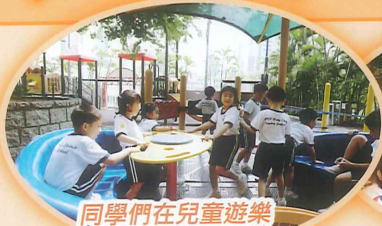
同學們在兒童遊樂場玩得十分愉快!!