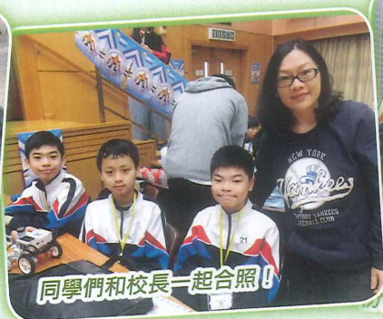
同學們和校長一起合照！