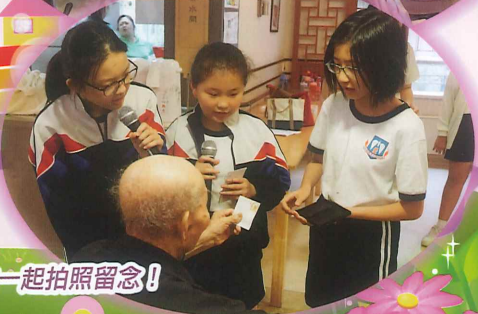
我們和院友一起拍照留念！