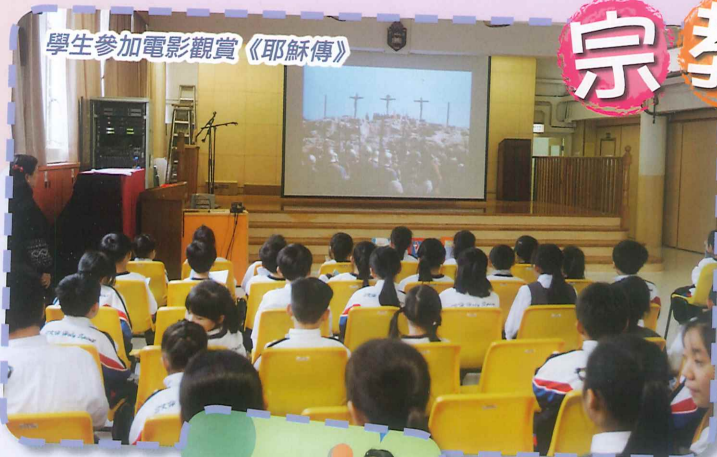
學生參加電影觀賞《耶穌傳》

學生在午息及課餘時自由參加，兩天的電影觀賞活動同學們都十分踴躍參與。他們透過「難忘片段」工作紙，分享了觀賞後的感受。而復活節海報設計優異作品已張貼於校內前、後梯供大家欣賞。