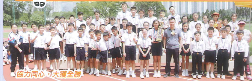
協力同心，大獲全勝