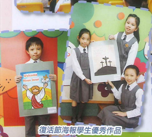
復活節海報學生優秀作品