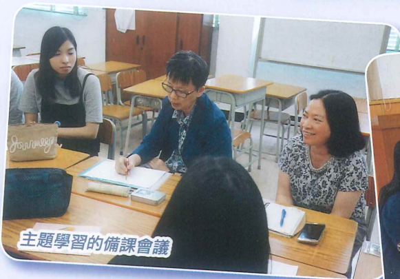
主題學習的備課會議

本年度參加由香港中文大學優質學校改進計劃，「校本專業支援計劃一促進學生STEM素養」，教師專業發展活動。透過不同的教師工作坊，培訓老師對STEM教育的發展，希望藉著專業的學術交流、備課，提升學與教。