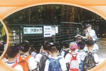
同學們留心聽着老師的介紹。