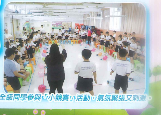
全級同學參與「小競賽」活動，氣氛緊張又刺激。