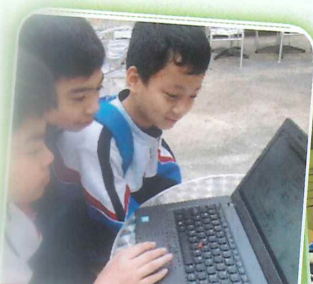
同學們努力地編寫程式。

我們的IT大使參與了學校提供的IT訓練課程，學生透過App Inventor 2設計了捧餐及追蹤遊戲。課程不但啟發學生的創意力，還提升了學生編程的能力。