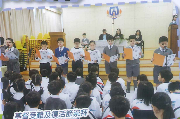
基督受難及復活節崇拜