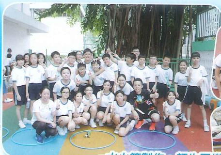
水火箭製作，師生同樂。