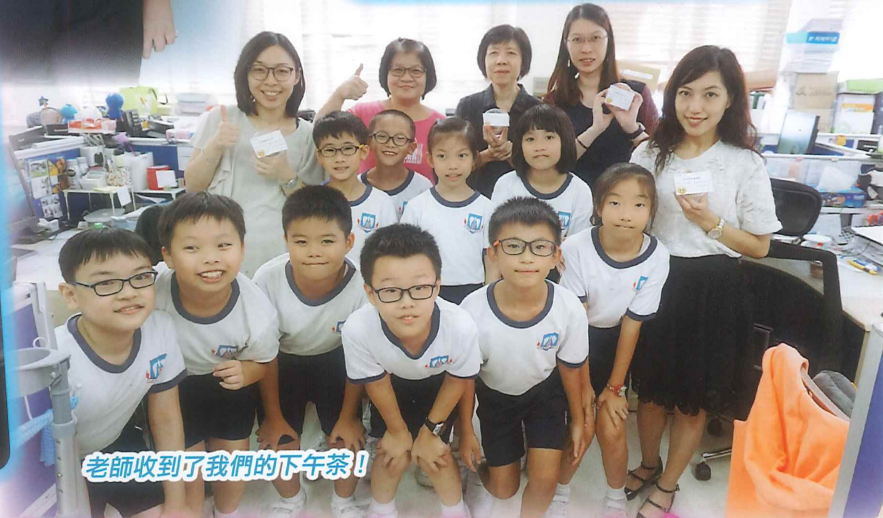
老師收到了我們的下午茶！