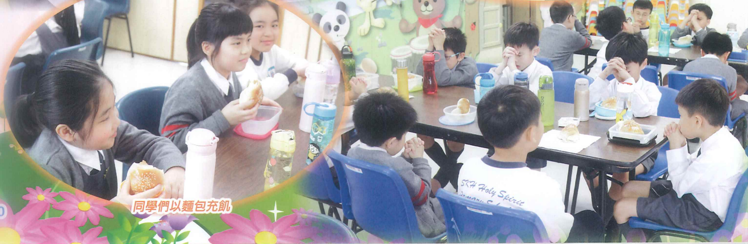
同學們以麵包充飢