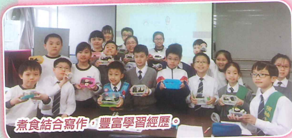
煮食結合寫作，豐富學習經歷。

學生於三月及五月參與由語常會及太陽樹中文教育中心合辦的製作壽司工作坊及名人分享會，活動讓學生透過製作食物過程及飲食傳媒工作者分享，學習如何以文字介紹美食。