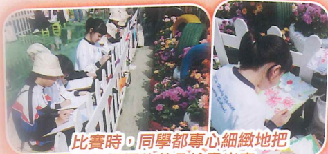
比賽時，同學都專心細緻地把開得燦爛的花朵繪畫出來。