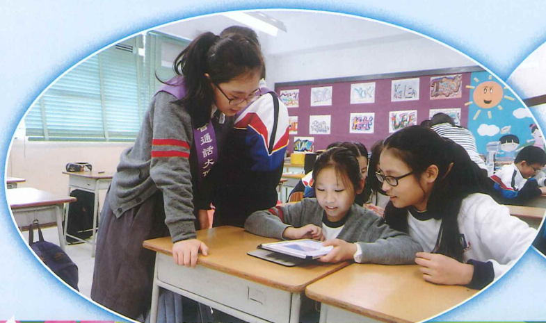
普通話大使從旁協助活動進行。

為了讓學生以更有趣的形式學習聲、韻母，普通話科於下學期普通話日舉行平板電腦遊戲，透過活動令三至六年級學生更輕鬆掌握語音知識。