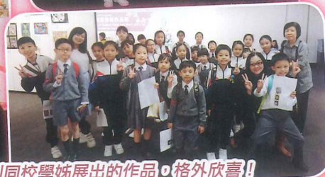
同學看到同校學姊展出的作品，格外欣喜！