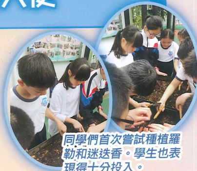
同學們首次嘗試種植羅勒和迷迭香。學生也表現得十分投入。

本學期成立了校園綠色大使，參加了由香港浸會大學主辦的「家校齊創綠色生活-校園天台綠化計劃」。在學校的一角建立了桌上花園。