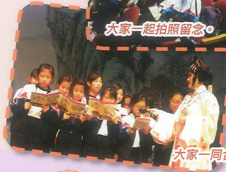
大家一同合唱帝女花。