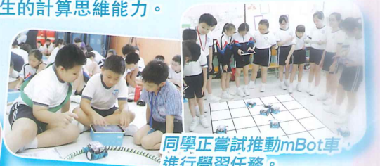
同學正嘗試推動mBot車，進行學習任務。