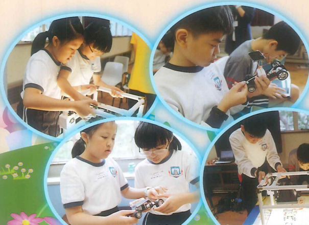
同學們從活動中了解到太陽能的各方面應用及如何融入生活中。