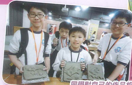
同學對自己的作品相當滿意。

本年度，五年級學生參加由教育局舉辦之「同根同心」- 香港初中及高小學生內地交流計劃。全級學生參與「佛山的嶺南文化」(一天)的交流活動，透過參訪南風古灶、佛山祖廟及民間藝術社，讓學生了解嶺南文化及歷史。同學更有機會體驗陶瓷製作，了解陶藝的創作過程，藉著不同的學習經歷，加深同學對中國歷史文化的認識。