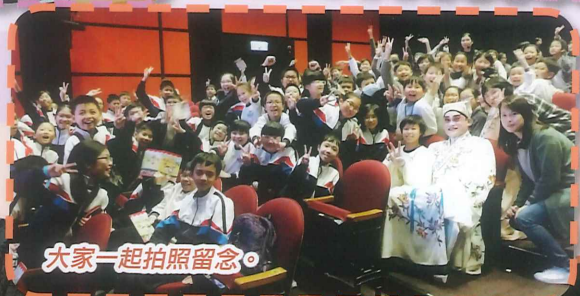
大家一起拍照留念。

另外，高年級同學亦參加了由香港八和會館舉行的粵劇欣賞工作坊。當日同學親臨油麻地戲院，聆聽著名大老信講解粵劇知識和觀看折子戲「雙仙拜月亭」。最後，同學有機會和演員一同合唱《帝女花》和拍照留念。