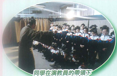
同學在演教員的帶領下扮演村民進行學習。

本年度，四年級學生參加由香港賽馬會慈善信託基金撥款 愛麗絲劇場實驗室策劃及推行「賽馬會諸子百家教育劇場發展計劃」。透過戲劇教學，同學在專業的演教員帶領下，走到春秋戰國時代，每位同學帶著角色，學習諸子百家學說，認識中華文化及歷史。與此同時，同學藉著戲劇認識中國歷人物，以古論今，進行公民教育，培學學生良好品格。