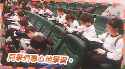
同學們專心地學習。